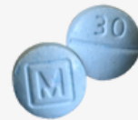
FAKE oxycodone m30 tablets*