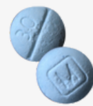
AUTHENTIC oxycodone m30 tablets*

Fake prescription pills are easily accessible and often sold on social media and e-commerce platforms making them available to anyone with a smartphone, including minors.