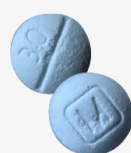
AUTHENTIC oxycodone m30 tablets*

Fake prescription pills are easily accessible and often sold on social media and e-commerce platforms making them available to anyone with a smartphone, including minors.