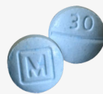
FAKE oxycodone m30 tablets*